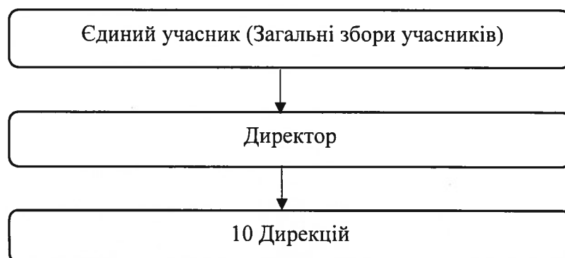
Рис.1 Спрощена організаційна структура.

Спрощена організаційна структура наведена нижче в рисунку 1.